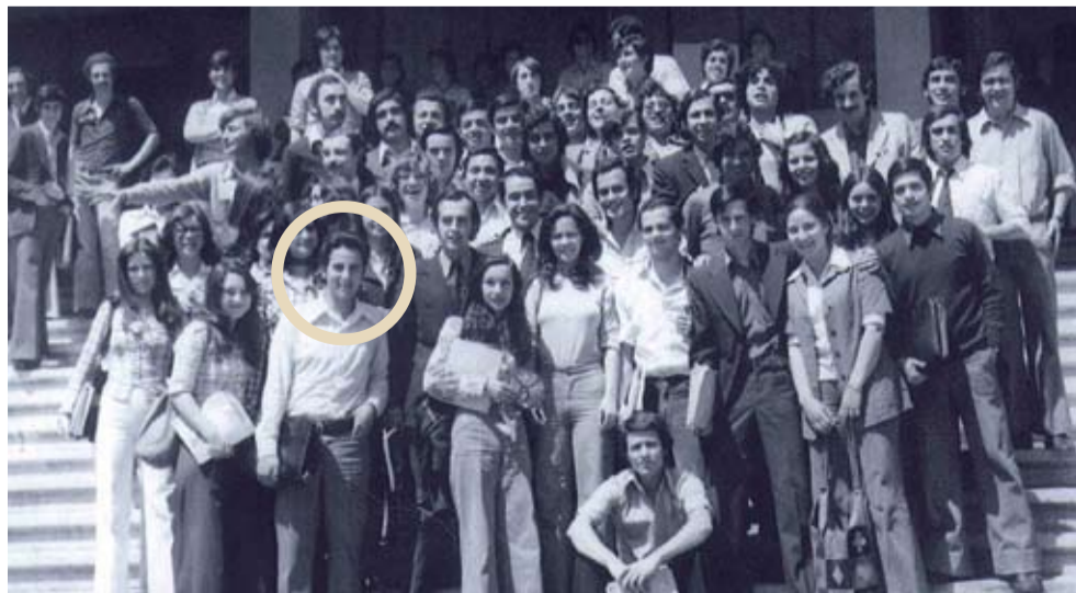
En 1972 entró a estudiar Derecho en la Universidad de Chile. Aunque fue una época políticamente convulsionada, eso no le impidió “obtener una muy buena formación y conocer a mucha gente interesante”, cuenta el rector. En la foto aparece con sus compañeros de curso frente a su Facultad.