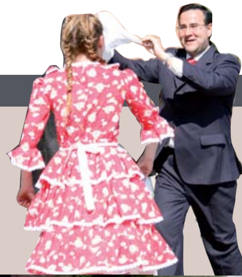
Con mucho ánimo, el rector de la Universidad, Orlando Poblete, deleitó a los alumnos con unos pies de cueca durante el esquinazo.

1. Las alianzas roja, azul y blanco llenaron de color el campus de la Universidad. La roja -compuesta por Derecho, Periodismo, Historia, Pedagogía, Párvulos, Filosofía y Bachillerato- se quedó con el primer puesto. ¡Felicidades!