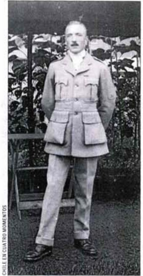
CHILE EN CUATRO MOMENTOS