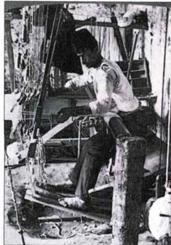
CHILE EN CUATRO MOMENTOS