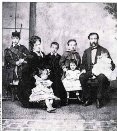
CHILE EN CUATRO MOMENTOS