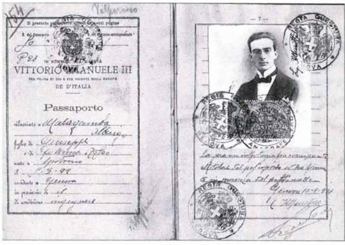
CHILE EN CUATRO MOMENTOS