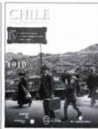
"CHILE EN 4 MOMENTOS, 1910", VOLUMEN 4, Universidad de los Andes, Grupo Enersis y "El Mercurio". 72 p. Circula este miércoles.

UN ALEMÁN LLEGA A SER JEFE DEL EJÉRCITO Desde mediados del siglo pasado, se ha registrado un aumento de los alemanes que llegan a residir a nuestro país, debido a una activa campaña del gobierno chileno para atraer a profesionales y artesanos para colonizar zonas del sur de Chile, especialmente entre Valdivia y Puerto Montt. Desde 1880 será el período de mayor esplendor de la colonia alemana, constituyendo un polo de desarrollo industrial, logrando reactivar la economía de la zona sur del país. Sin embargo, la influencia germana ha llegado mucho más allá que el área industrial y comercial, ya que hasta el alemán Emil Körner alcanza el grado de Comandante en jefe del Ejército y en el área educacional con el nuevo método para la enseñanza simultánea de la lectura y escritura.