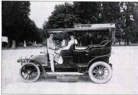
CHILE EN CUATRO MOMENTOS

Para los chilenos más acomodados de 1910, viajar a Europa, aunque sólo sea una vez en la vida, es un anhelo que llega a dividir la vida en un antes y un después. Esto se debe no sólo a su cultura milenaria, sino que también porque le permite al viajero chileno ver con otros ojos la realidad de su propio país. París, el centro de atracción de mayor importancia durante el siglo XIX, ahora disputa su primacía con Roma, Londres y Berlín. De todas maneras, no es fácil para los chilenos llegar al Viejo Mundo, ya que es necesario atravesar las tormentosas aguas del Cabo de Hornos y todas las incomodidades de un largo viaje, que se olvidan al desembarcar e iniciar la gran aventura. Desde luego, no todos los compatriotas nuestros que cruzan el Atlántico son simples turistas: hay quienes viajan en importantes misiones de Gobierno; otros son educadores o militares que quieren conocer las profundas reformas que se suceden en varios países europeos. También podemos encontrar pintores, como Juan Francisco González, que viven la rica vida bohemia de la orilla del Sena; y empresarios como Federico Santa María y el aviador José Luis Sánchez Besa, que está instalando una industria aeronáutica en Francia. Chile se va haciendo más conocido.