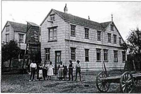
CHILE EN CUATRO MOMENTOS

UN ALEMÁN LLEGA A SER JEFE DEL EJÉRCITO Desde mediados del siglo pasado, se ha registrado un aumento de los alemanes que llegan a residir a nuestro país, debido a una activa campaña del gobierno chileno para atraer a profesionales y artesanos para colonizar zonas del sur de Chile, especialmente entre Valdivia y Puerto Montt. Desde 1880 será el período de mayor esplendor de la colonia alemana, constituyendo un polo de desarrollo industrial, logrando reactivar la economía de la zona sur del país. Sin embargo, la influencia germana ha llegado mucho más allá que el área industrial y comercial, ya que hasta el alemán Emil Körner alcanza el grado de Comandante en jefe del Ejército y en el área educacional con el nuevo método para la enseñanza simultánea de la lectura y escritura.