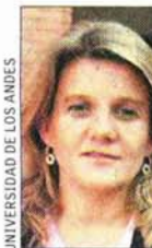
UNIVERSIDAD DE LOS ANDES

Los niños aprenden por medio del juego, pero es importante que los papás observen si los niños van al jardín sólo a pasar el tiempo y a entretenerse o si ese juego tiene una intencionalidad educativa consciente de parte de las educadoras”.