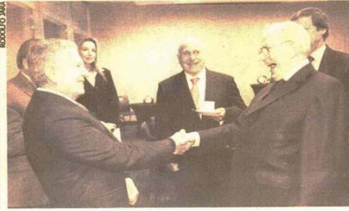
El ex presidente del Banco Central, Carlos Massad, saluda afectuosamente a Michel Camdessus.