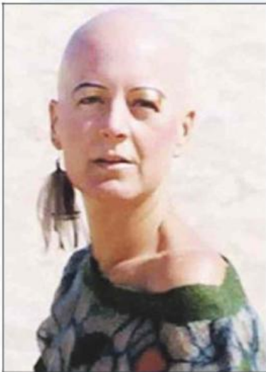
Paula no tiene ni un pelo.