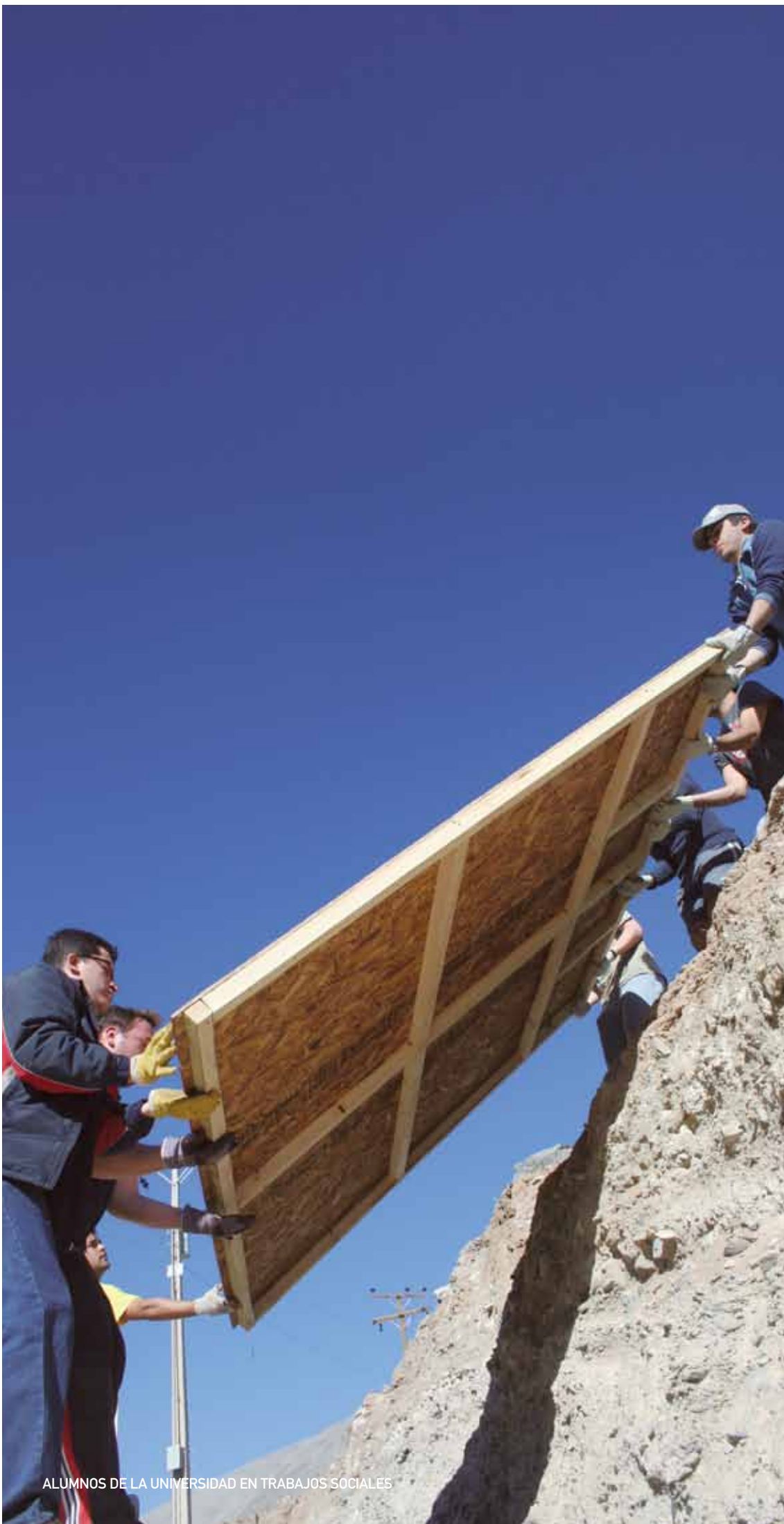
ALUMNOS DE LA UNIVERSIDAD EN TRABAJOS SOCIALES