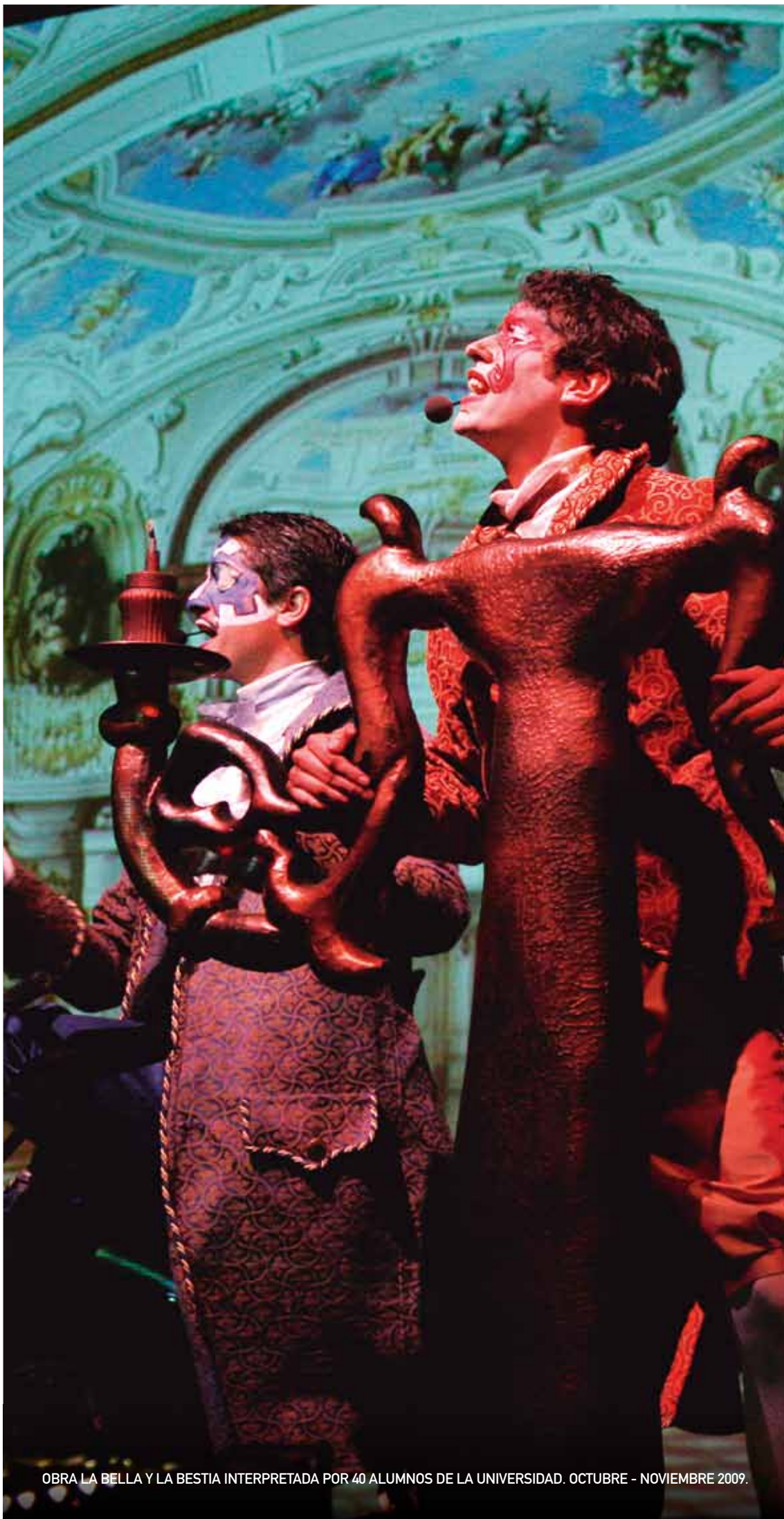
OBRA LA BELLA Y LA BESTIA INTERPRETADA POR 40 ALUMNOS DE LA UNIVERSIDAD. OCTUBRE - NOVIEMBRE 2009.

El lunes 21 de diciembre, a partir de las 09:00 hrs, en el edificio El Reloj encontrarás stands de cada una de las carreras que la Universidad ofrece. Podrás conversar con académicos y alumnos para orientarte en relación a tus intereses vocacionales.