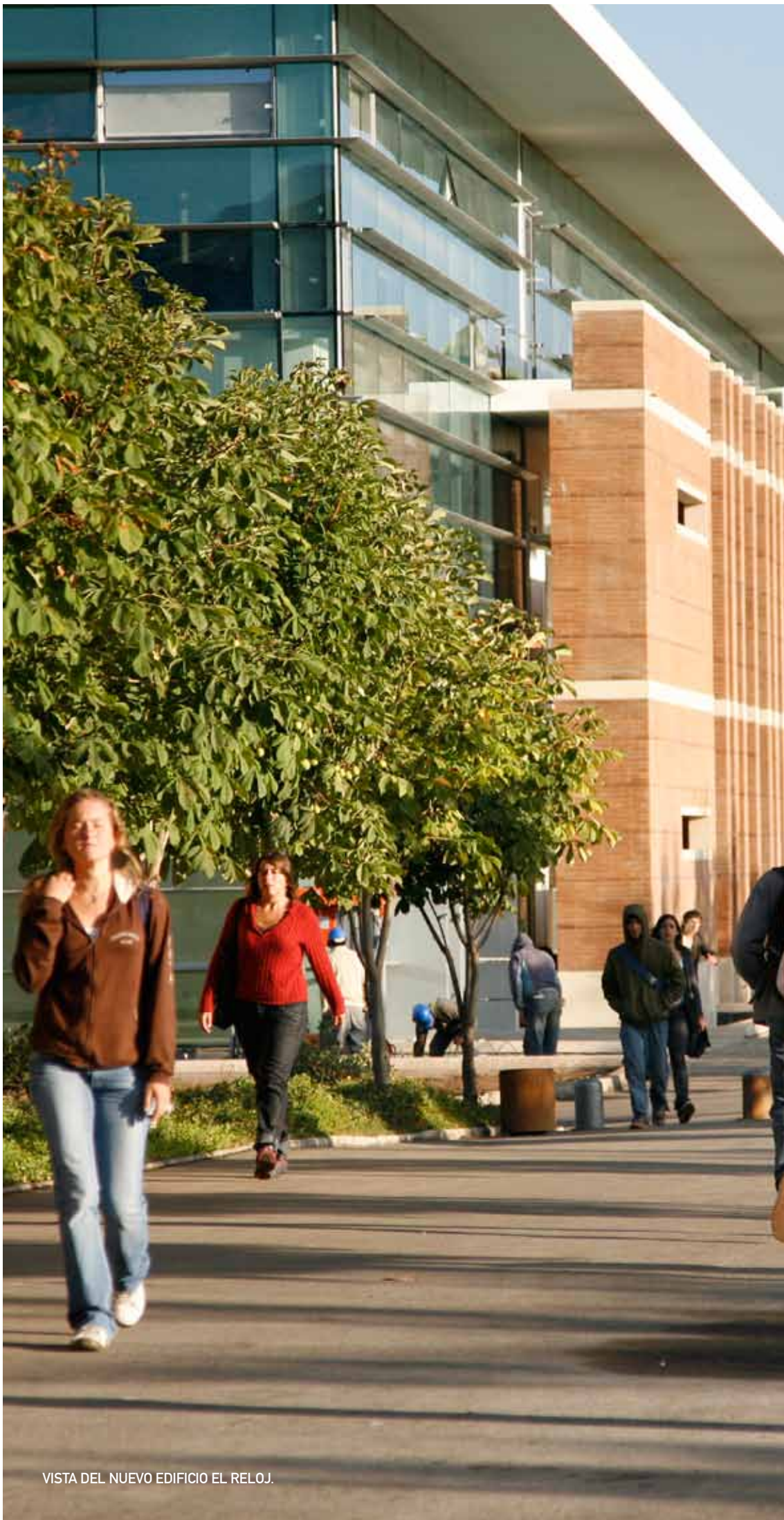
VISTA DEL NUEVO EDIFICIO EL RELOJ.