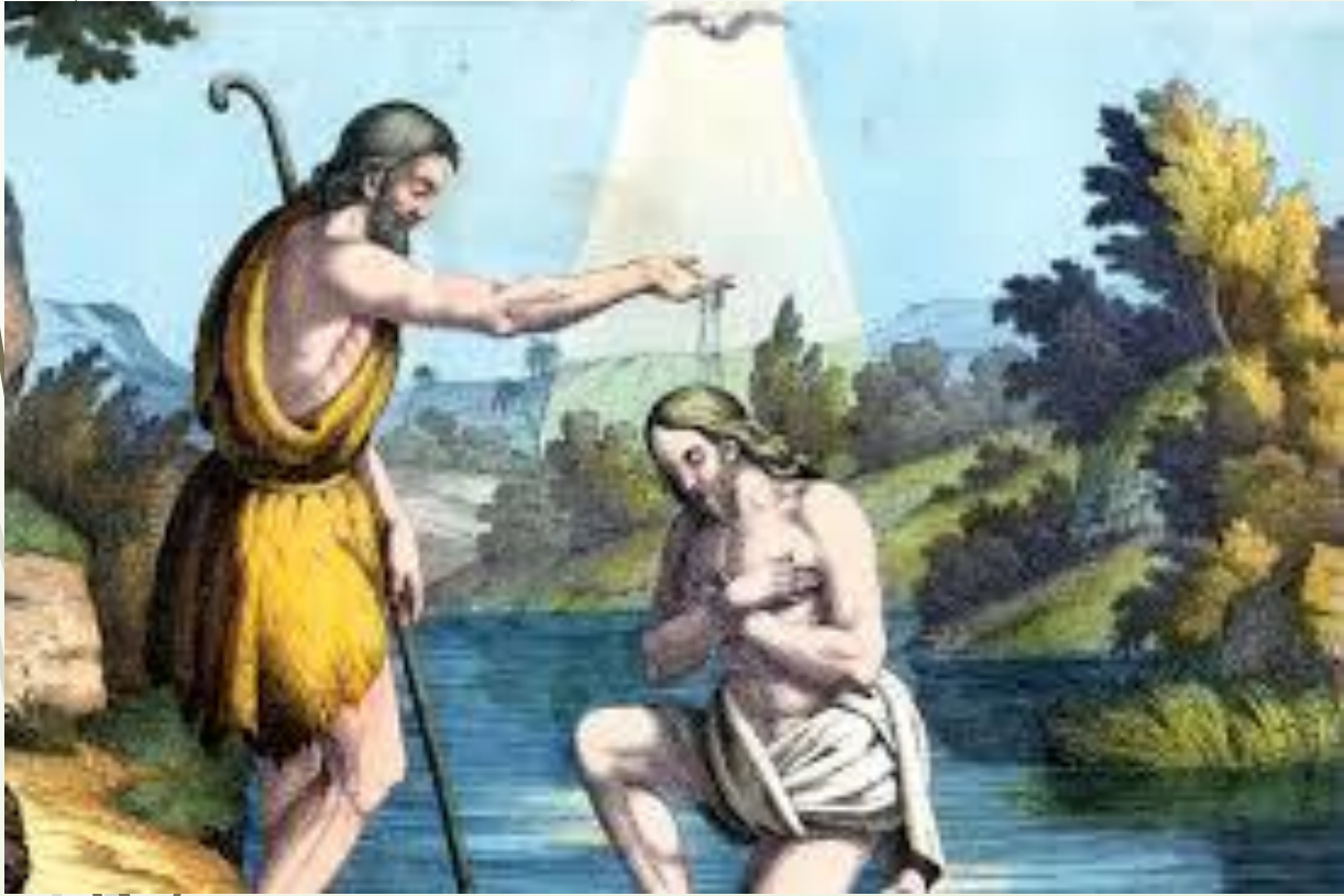
Juan Bautista, bautiza a Jesús en el río Jordán.

“Entonces vino Jesús al Jordán desde Galilea, para ser bautizado por Juan. Pero éste se resistía diciendo: