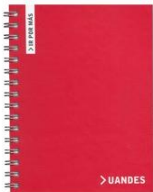
CUADERNO $ 2.800 Código: 10013402