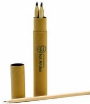
SET 6 LÁPICES GRAFITO NEGRO $ 1.000 Código: 10013582