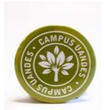
CHAPITA IMÁN $400 Código: 10013211