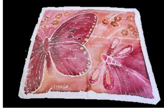
PAÑUELO DE SEDA FUCSIA