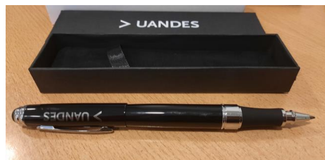
ROLLER CORPORATIVO $ 4.100 Código: 10013378