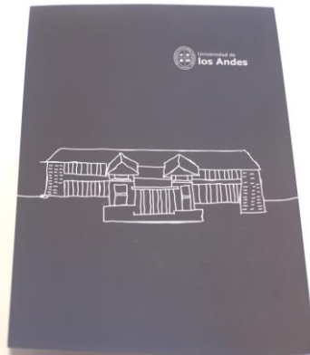
BLOCK UANDES $ 920 Código: 10014557