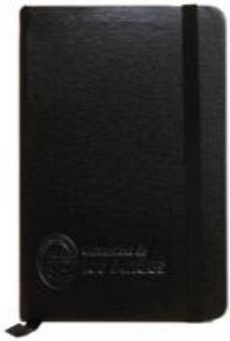
LIBRETA $ 2.680